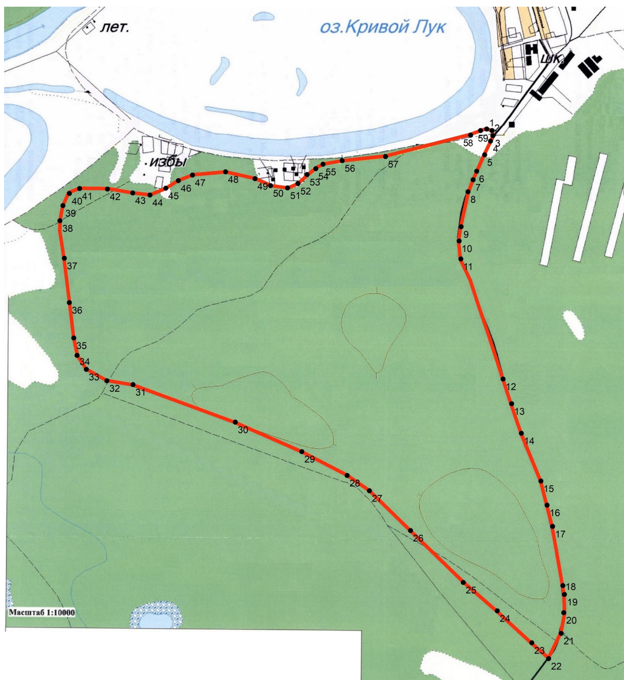
КАРТА-СХЕМА ПАМЯТНИКА ПРИРОДЫ РЕГИОНАЛЬНОГО ЗНАЧЕНИЯ «КРИВОЛУКСКИЙ БОР» М 1:15 000